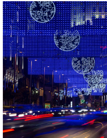
Moon light installation – Madrid – 2014