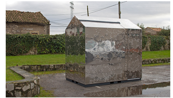
Kiosco m.poli – Madrid – 2006