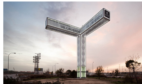
Sign System – Madrid – 2010